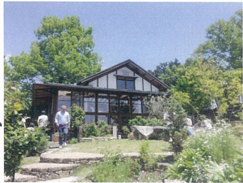
可児郡 森のケーキ香房 ラ・プロバンス さん

☆ゴールデンウィーク 皆さま こんにちは!! 今年もモデルハウスでイベントを 開催した関係で連休はとら ずしてしたので、近所へ出掛 けました。右は旧中山道沿いに ある山の上のケーキ屋さんで、2回 目の訪問です。人気のケーキ屋 で1時間程待ちました。きれ いな庭と雑貨屋があり、並ぶ でけありません。昔では ありませんでした。私はヨーグル トにしましたが、カスタードが かためで、今風で厚くしっか りとした味で美味でした!! 妻は抹茶とホワイトチョコのケ ーキでこちらもおいしかったです!!