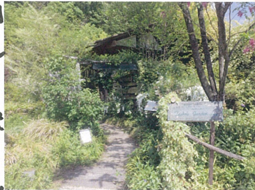
花フェスタ記念公園 ターシャの庭